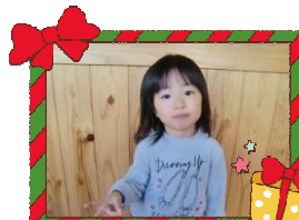
しずくちゃん 3さい