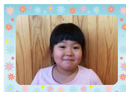
ここねちゃん 5さい