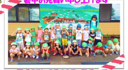
平成25年7月31日 職員一同

8月は、旅行やレジャー等外に出かけたり、お盆の時期などは、ご家族でのんびり過ごすといった時間が増えるのではないのでしょうか。ゆとりのあるスケジュールを立て、楽しい時間をお過ごしください。保育園でも水分補給や適度な休息を取りながら、夏を楽しく！そして健康的に過ごしていきたいと思います。