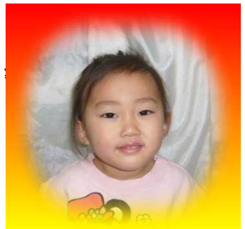
もえちゃん (3さい) 大きくなったら「ピンクの プリキュア」になるそうです