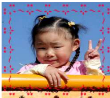
ことみちゃん(4さい) いつもニコニコ笑顔で弟 おもいの優しいお姉さん