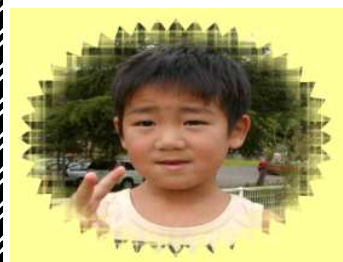
あやとくん(5さい) おりがみがじょうずで 昆虫を上手につくります