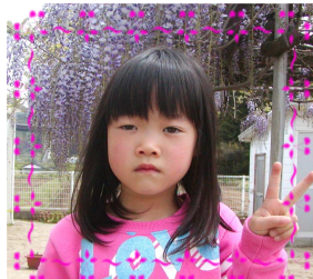
みさきちゃん(5さい) おかあさんごっこ大好き ピンクさんのお世話も上手