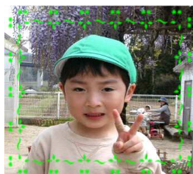
ゆうきくん(4さい) 絵本が大好きです