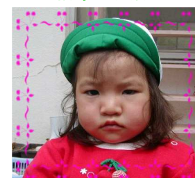
みかちゃん(2さい) 音楽や踊りが大好き