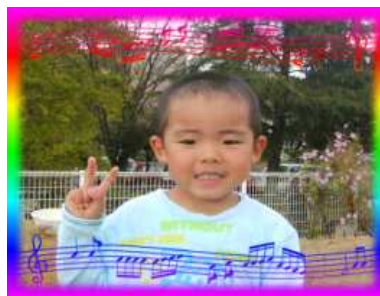
ともくん(4さい) 誰にでもやさしくて 心の強い子に育ってね