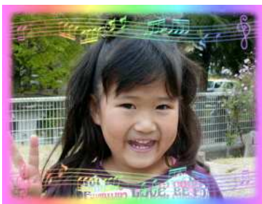
さわちゃん(5さい) 明るく元気で笑顔の似合う 思いやりのある子になってね!