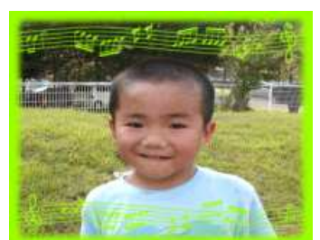
れいじくん(5さい) 優しくたくましい 男の子になってね