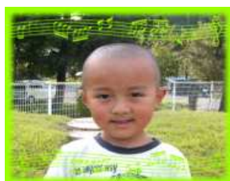
しょうえいくん(5さい) 思いやりで優しい 子になってネ!!