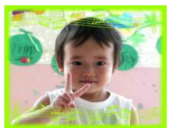
ゆうぞうくん(3さい) これからもなんでもよくたべ げんきなあかるい子になってね