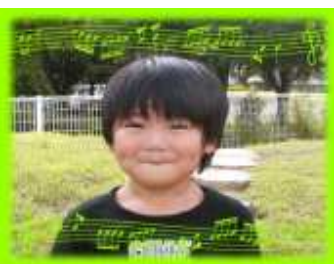
あやとくん(4さい) 元気でやさしい 子に育ってね