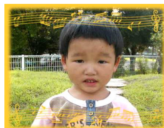
ゆきえちゃん(4さい) 兄弟なかよく あそんでね!