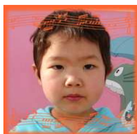
かなちゃん(4さい) あかるくすなおに そだってネ!!