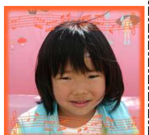
あかねちゃん(4さい) 明るく・元気で・思いやりの ある子になっ てネ!!