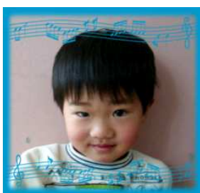
だいきくん(3さい) たくましくつよい 子になっ てほしい