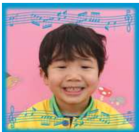
ゆうきくん(6さい) おとこらしく たくましくなっ てね!!