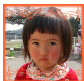
りなちゃん(2さい) 元気でおもいやりの ある子に育っ てね